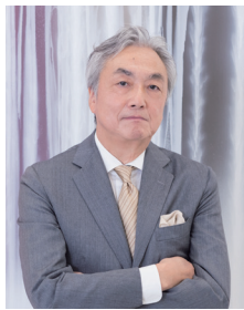
千住博 日本画家 Hiroshi Senju

1958年東京生まれ。東京藝術大学美術学部絵画科日本画専攻卒業。同大学院修了。95年ヴェネチア・ビエンナーレ国際美術展名誉賞。イサム・ノグチ賞、日米特別功労賞、外務大臣表彰、恩賜賞、日本芸術院賞、日米協会金子堅太郎賞特別賞をそれぞれ受賞。メトロポリタン美術館、ブルックリン美術館、シカゴ美術館、国立故宮博物院(台湾)、英国国立ヴィクトリア&アルバート博物館等に常設され、国内では軽井沢千住博美術館、山種美術館、佐川美術館をはじめとして、大徳寺聚光院、薬師寺、高野山金剛峯寺、出雲大社等に収蔵。京都造形芸術大学学長を務め、2022年日本藝術院会員に任命。