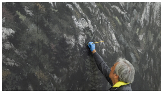
5月に奈良国立博物館で公開予定の渾身の御厨人窟最新作《遠かなる響き》(横約5m)の仕上げをする作者(2025年3月)