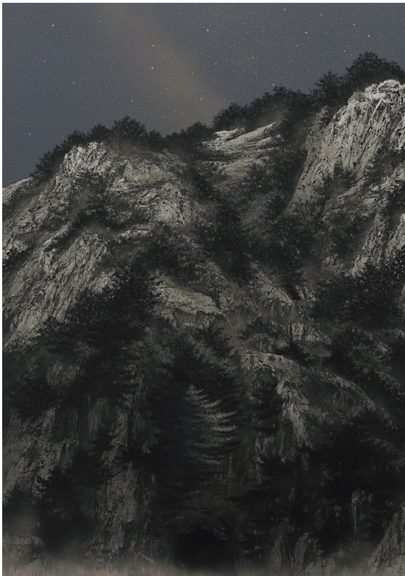
《御厨人窟》2024年 259.1×181.8cm 紙本彩色 軽井沢千住博美術館蔵