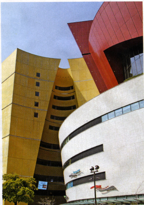
Улазак у галерију: Спољашњост зграде у градињу Китакјушу

И у једном и у другом. Кјоту је сачувао свој стари идентитет, али је Токио